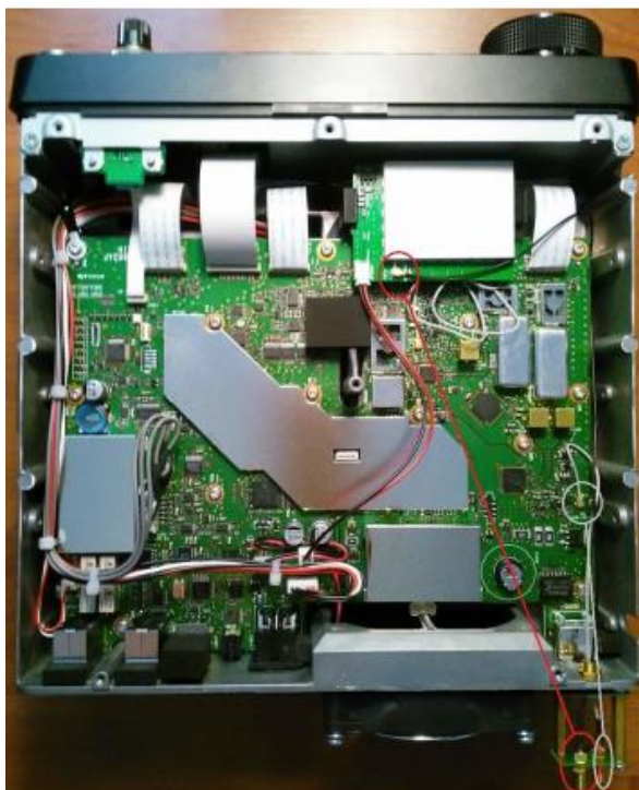
Figura 4: Salida de RF junto con la entrada de la esfera de REF.