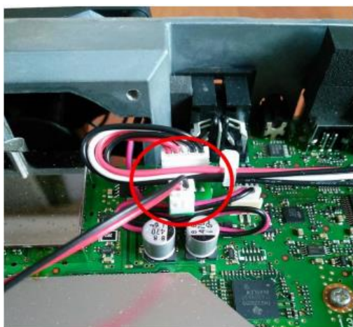
Figura 2: Conexión del adaptador de corriente.