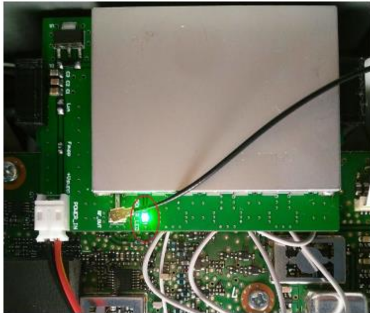
Figura 6: PTRX-9700 instalado con energía.

Para asistencia técnica puede comunicarse con nosotros en radiospectral@gmail.com