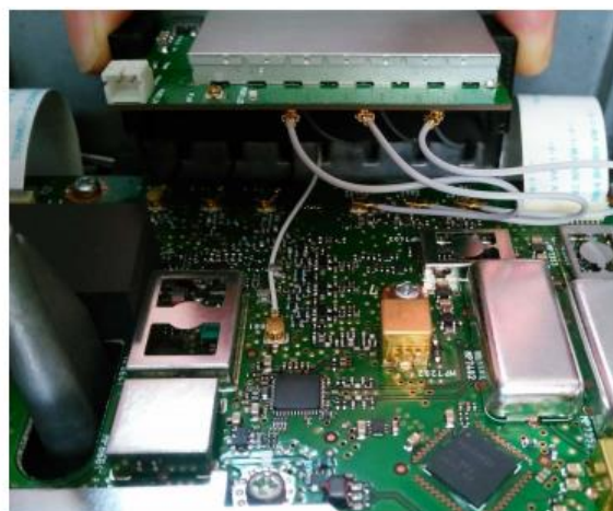
Figura 3: Conexiones de cable de Bypass