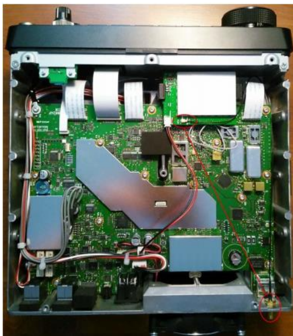
Figura 5: Salida RF directa (para usuarios que no usan la esfera de REF)